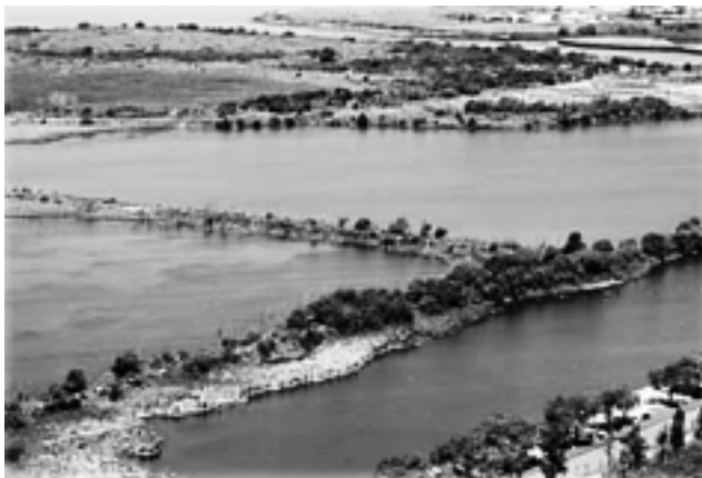
Hier sieht man die drei wichtigsten Lagunen des Parkes von oben: Coipos Lagune, Schildkröten Lagune und Möwen Lagune.

Am 12. August 2005 besuchten wir, die 9. Klasse der Pestalozzi Schule, die Reserva Ecológica Costanera Sur. Ziel war es, sich über die Pflanzen- und Tierwelt des Parkes zu informieren. Ein Student führte uns und beantwortete unsere Fragen.