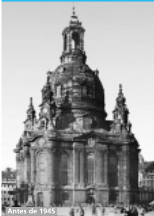
Antes de 1945

Año 11 N° 58 Boletín Institucional de la Asociación Cultural Pestalozzi Octubre - Noviembre